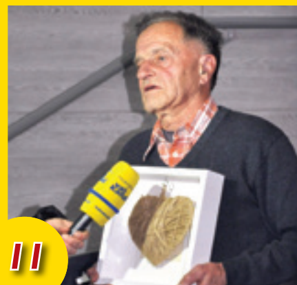
Srečanje literatov PZDU