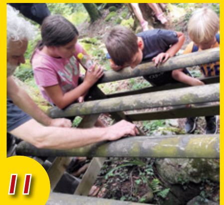
Prvi jesenski pohod društva upokojencev NM