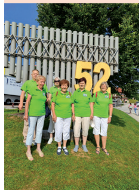
Naši pevci na 52. Taboru slovenskih pevskih zborov Šentvid pri Stični, 18. junija 2023.