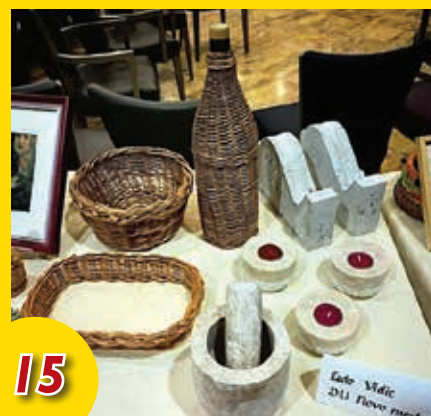
Medgeneracijska ustvarjalna delavnica na OŠ Drska